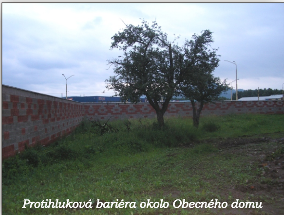
Protihluková bariéra okolo Obecného domu

Po schválení našej žiadosti o nenávratný finančný príspevok z fondov EÚ, mali by začať aj práce na projekte „Regenerácia centrálnej zóny obce Lubotice“. Bola podpísaná zmluva o poskytnutí finančného príspevku s MVR SR. Kontrolou musí prejsť verejné obstarávanie a následne s víťazom bude podpísaná zmluva.