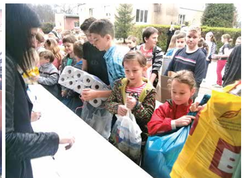
humanitárna pomoc pre ľudí na Ukrajine