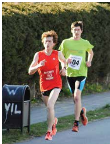
Jarný beh-vedúca dvojica