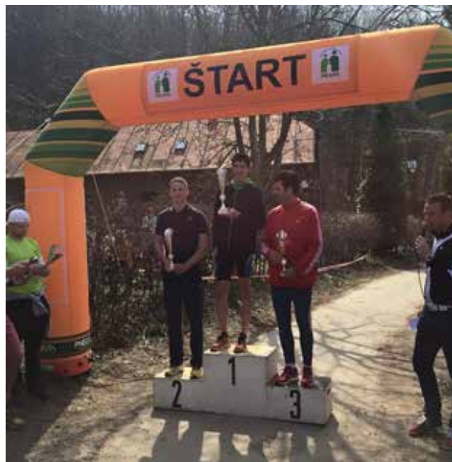
Beh pro Autis - vyhlásenie víťazov