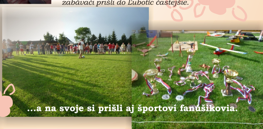
...a na svoje si prišli aj športoví fanúšikovia.