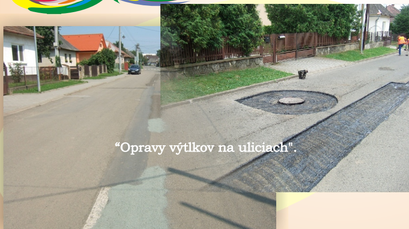
“Opravy výtčkov na uliciach”.