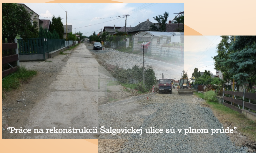
“Práce na rekonštrukcii Šalgovickej ulice sú v plnom prúde”

Skôr ako sa začne s prístavbou Materskej školy musel byť demontovaný altánok v záhrade, ktorý bol premiestnený na iné miesto a orezaná lipa”.