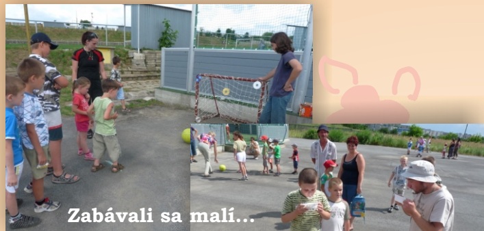
Zabávali sa malí...