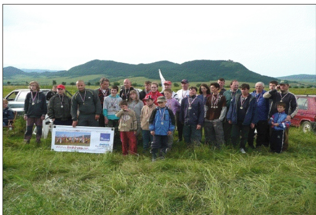
Spoločná fotografia víťazov M SR vo voľných leteckých modeloch kategórie H, A3, F1H, F1K a P30

Na prešovskom letisku sa 26.6.2010 stretli leteckí modelári z celého Slovenska, aby si zmerali svoje sily v boji o majstrovské tituly.