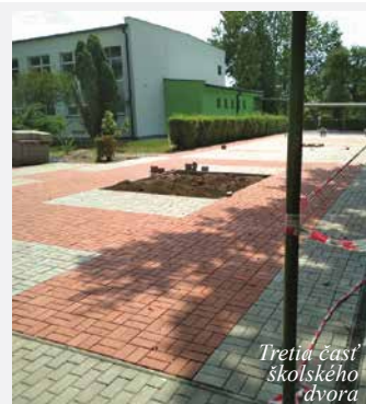
Tretia časť školského dvora