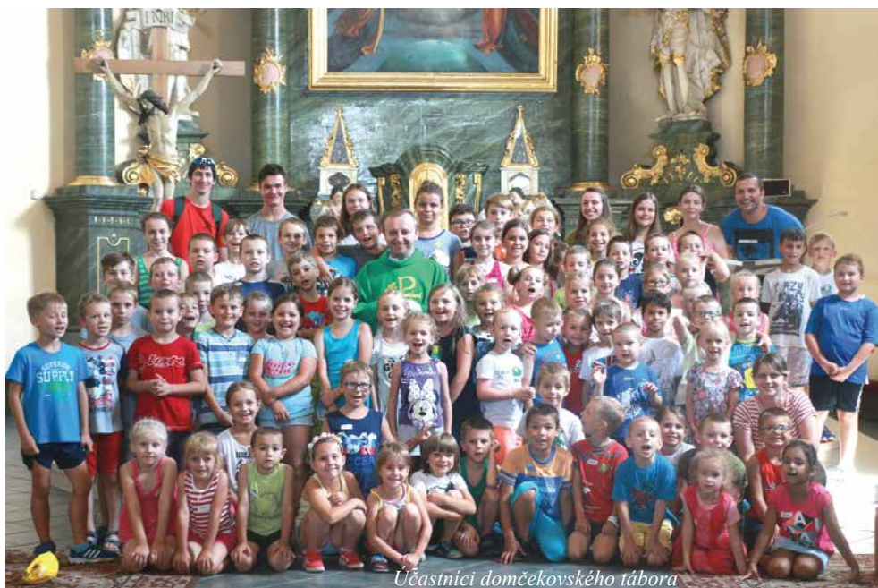
Účastníci domčekovského tábora

Počas druhého turnusu sme sa spolu so 78 deťmi preniesli do dávnej doby a to do Perzskej ríše. Tu sa za čias Nehemiáša začala obnova zničeného Jeruzalema. V prvom rade deti museli nájsť stratenú mapu s mestskými bránami, objaviť vzácné kamene a potom sa už s chuťou mohli s pustiť do budovania Jeruzalema. Svoje sily a zručnosti si deti merali na cvičisku počas športových hier. Na tvorivých dielňach ako Jeruzalemskí remeselníci pracovali s hlinou, vyrábali recyklované poháre, či vytvárali krabicové hrady. Koniec tábora zavŕšilo slávnostné odovzdávanie čestného občianstva starobylého mesta Jeruzalem pre každého účastníka.