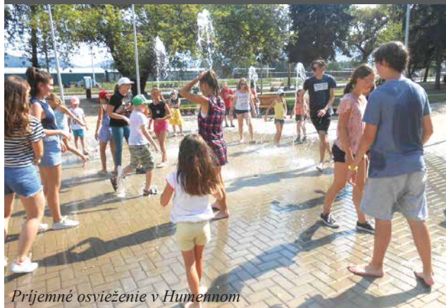
Prijemné osvieženie v Humennom