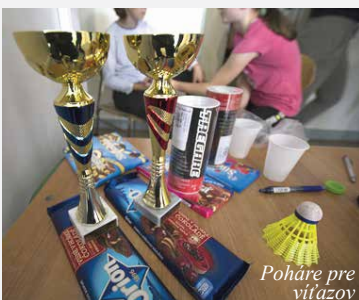
Poháre pre víťazov