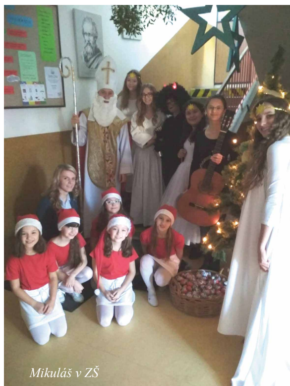
Mikuláš v ZŠ

Prezentáciou svojich darov by sme radi prispeli aj k obohateniu Vianočných trhov v Ľuboticiach – výrobkami i sprievodným kultúrnym programom. Nezabudli sme ani na našich rodičov a blízkych, pre ktorých je 17.12.2018 o 16.00 hod. pripravená