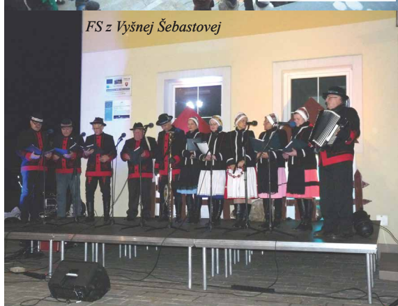
FS z Vyšnej Šebastovej

Stalo sa peknou a milou tradíciou, že sa stretávame na námestí pred OcÚ na Vianočnom trhu. Tento rok v piatok 14.12.2018 je to už 5. trh, ktorý sme pre vás pripravili. Už od obeda bol čulý ruch na námestí, kde sa chystali stánky, pódium, stan s občerstvením a iné.