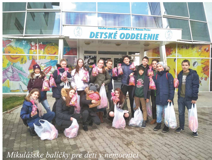
Mikulášske baličky pre deti v nemocnici

Sú chvíle, ktoré sú pre deti dosť zraniteľné. Takou je určite ich stretnutie s násilím či týraním. Aby sa na obeť takýchto tragédií nezabúdalo, k tomu slúži aj celoslovenská Bubnovačka. 19.11. sme sa k nej pridali aj my. Zišli sme sa v telocvični ZŠ, aby sme svojím