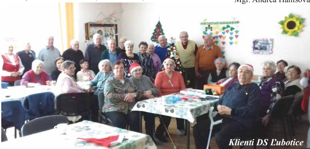
Klienti DS Lubicice