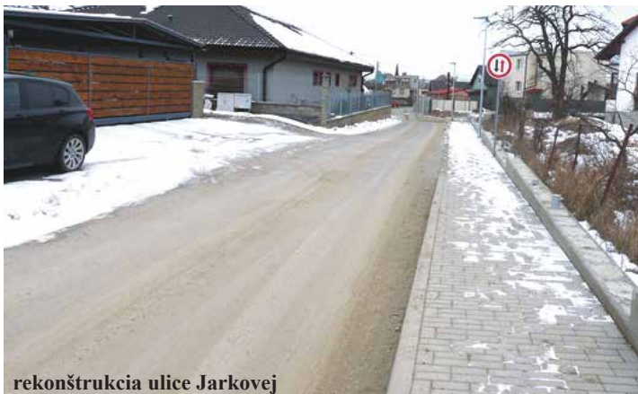
rekonštrukcia ulice Jarkovej