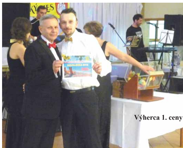
Výherca 1. ceny

Posledná januárová sobota už tradične patrí ľubotickému plesu. Je to už 10 rokov čo obec Lubicice usporadúva svoj obecný ples. Organizátorom sa určite vydaril zámer, aby to bol ples s príjemnou atmosférou, noblesný, ale nie snobsky, bohatý na návštevnosť. Ples sa stal peknou a prestížnou tradíciou v obci. Zúčastňuje sa ho veľká časť obyvateľov a priateľov obce. Medzi pozvanými sú aj cirkevní hodnostári farnosti a podnikatelia, ktorí majú sídla svojich firiem v územnej časti Lubicíc.