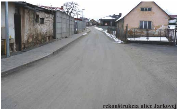
rekonštrukcia ulice Jarkovej