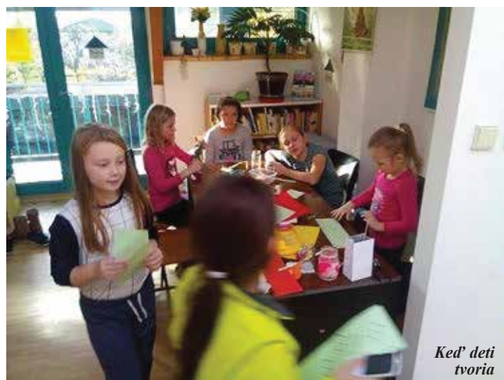
Keď deti tvoria

Je za nami rok plný činnosti pod hlavičkou projektu Nízkoprahových sociálnych služieb pre deti a rodinu.