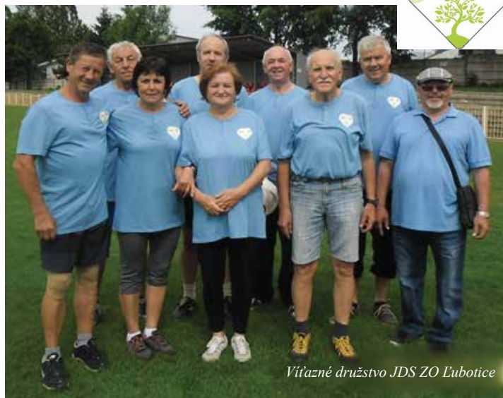
Vítané družstvo JDS ZO Ľubotice