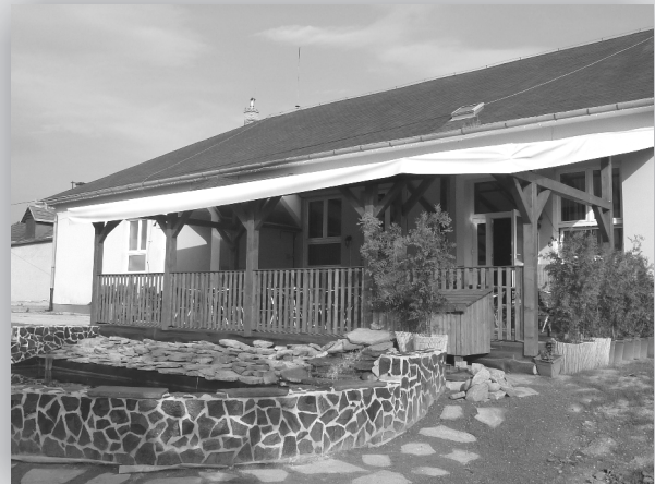
Letná terasa reštaurácie Obecný dom v Luboticiach

Prosíme prispievateľov, aby svoje príspevky do budúceho vydania Spravodaja posielali do 10.6.2013 na adresu redakcia@lubotice.eu