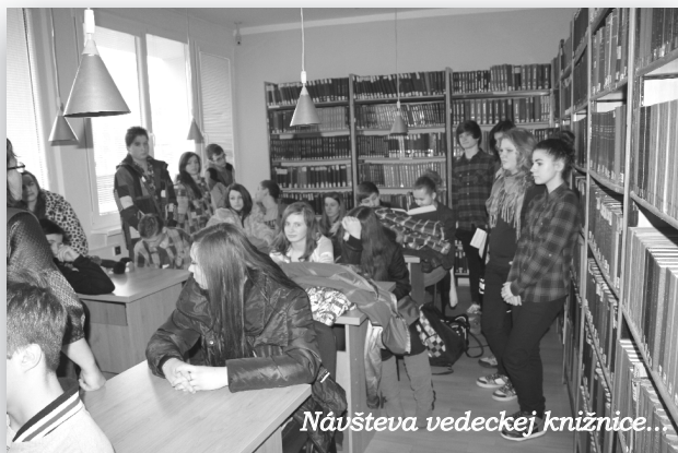
Náušteva vedeckej knižnice...

Nezabúdame ani na výchovu detí k schopnosti podeliť sa a spolupísať. Aj tento rok sme sa preto zapojili do zbierky ku DŇU NARCISOV (12.4.2013). Výťažok v hodnote 170 eur sme zaslali na pomoc pri liečbe onkologických pacientov.