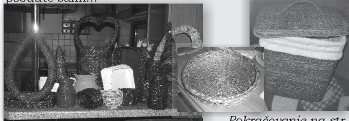
Pokračovanie na str. 4