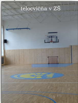
telocvična v ZŠ

Veľkou snahou našej obce v roku 2009 bolo získať finančné prostriedky na investičné akcie obce z fondu EÚ , a preto sme zodpovedne pripravovali projekty, aby sme mohli reagovať, keď bude vyhlásená výzva vhodná pre naše zámery. Na MVR SR sme predložili projekt komplexnej rekonštrukcie ZŠ. Žiaľ, naša žiadosť nebola schválená. Následne sme požiadali MŠ SR o dotáciu na riešenie havarijného stavu telocvične ZŠ . Tu sme boli úspešní a zo získanej dotácie vo výške 80362 €, spolu s finančnými prostriedkami obce sa nám podarilo komplexne zrekonštruovať interiér telocvične. Ťažiskom prác bola výmena podlahy, no dôležitými prácami boli aj rekonštrukcia kúrenia, vetrania, výmena elektrických rozvodov, nové osvetlenie, nové omietky a nový drevený obklad stien. Podmienky výučby telesnej výchovy, ale aj využitia telocvične širokou verejnosťou sú s neďávnou minulosťou neporovnateľne zlepšené.