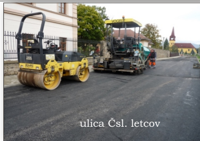
ulica Čsl. letcov

Ďalším veľkým projektom, ktorý sme podali na MVR SR v zmysle výzvy na regeneráciu sídel, bol projekt pod názvom „Regenerácia centrálnej zóny obce Lubotice“ . Naša žiadosť bola úspešná a projekt bol schválený. V rámci neho bude vybudovaná pred obecným úradom pešia zóna s lavičkami a zeleňou, súčasná cesta (vyústenie ulice Čsl. letcov) bude preložená vyššie a jej nové vyústenie na ul. Makarenkovu bude nad kostolom v úrovni domu, kde bolo kvetinárstvo (ten bude asanovaný). Zároveň budú na Krizovatkovej ulici v úseku od kostola smerom dole po križovatku v existujúcich zelených pásoch vysadené krásne stromy. Na Kalinčiakovej ulici bude položený nový asfalt, opravené chodníky a vybudované nové verejné osvetlenie. Na oboch zastáv-