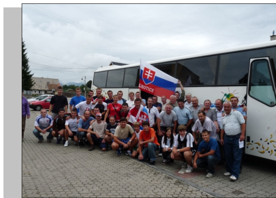
Naši fanúšikovia pred odchodom na futbalový zápas Slovensko-Česko, 5.9.2009 v Bratislave