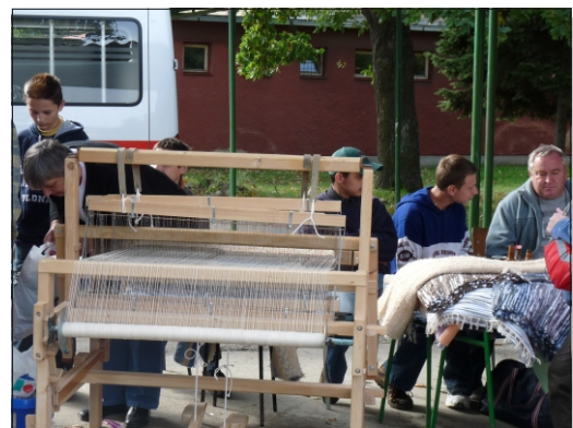
Všetci obdivovali prácu tkáča na krosnách.