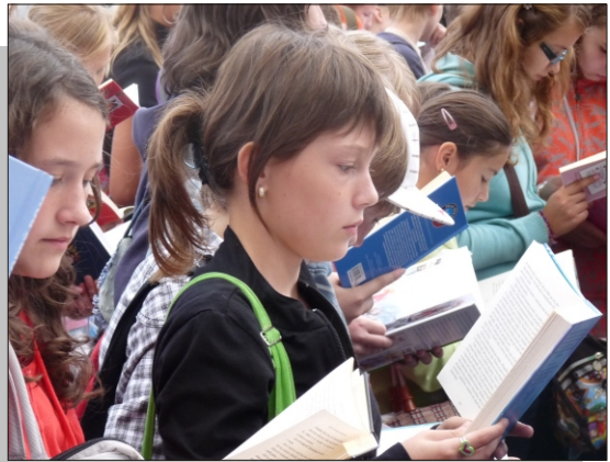
Čítali aj naši žiaci...