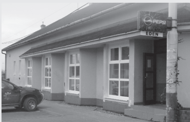
V reštaurácii Obecný dom boli vymenené okná