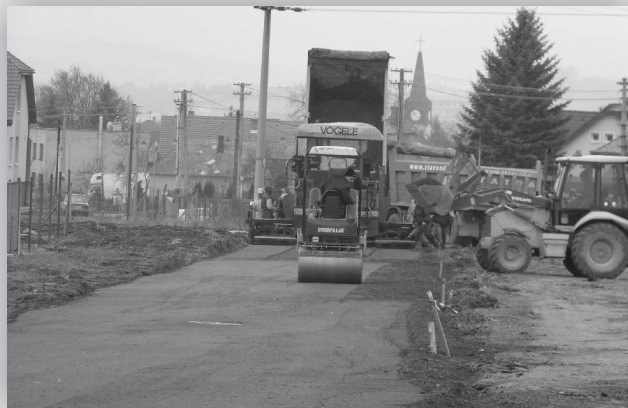
Ulica Makarenkova predĺžená