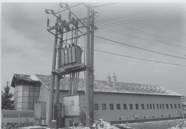
Výmena trafostanice pri ŠA - z toho dôvodu bolo aj častejšie prerušenie elektriny v starej časti Lubotic