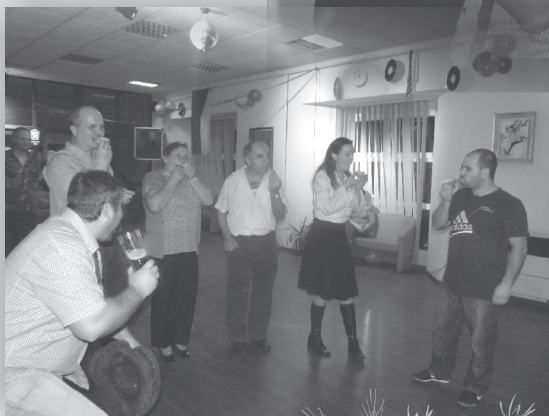
Súťaž - chlieb s masťou...