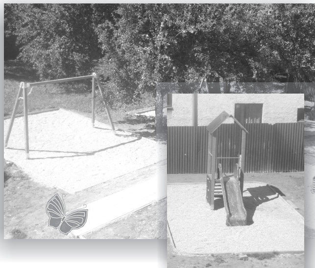
Na ihrisku prebiehajú ešte posledné úpravy