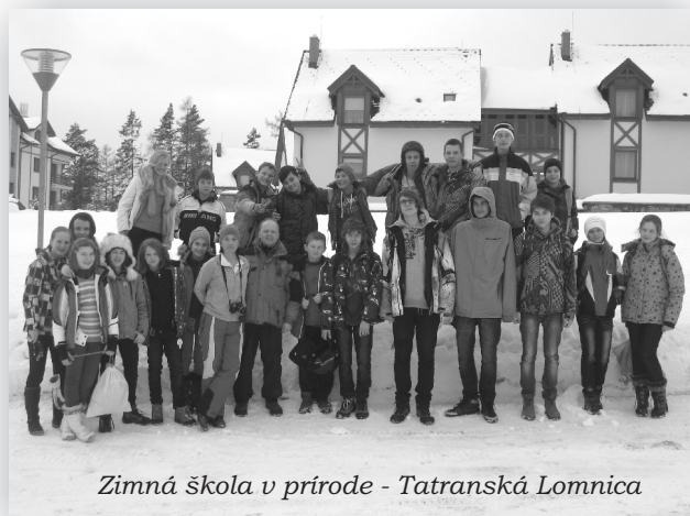
Zimná škola v prírode - Tatranská Lomnica