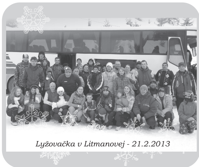
Lyžovačka v Litmanovej - 21.2.2013