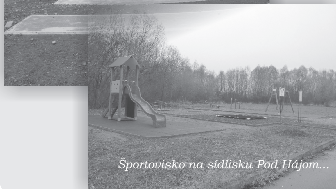
Športoviško na sídlisku Pod Hájom...

Na našom sídlisku Pod Hájom (Hapákova a Tekeľova ulica) je tiež veľa detí, preto sme sa rozhodli v spolupráci s Občianskym združením Život pod Hájom vybudovať tu detské ihrisko. V našej obci je to už tretie. Veľmi nám pri tejto akcii pomohol Prešovský samosprávny kraj, ktorý nám poskytol dotáciu vo výške 2 550 €. Takto sme aj v tejto časti obce vytvorili podmienky na pohybové aktivity detí a tým ich harmonický vývoj. Všetky prvky detského ihriska sú certifikované.