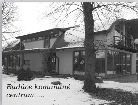
Budúce komunitné centrum.....

Na našom sídlisku Pod Hájom (Hapákova a Tekeľova ulica) je tiež veľa detí, preto sme sa rozhodli v spolupráci s Občianskym združením Život pod Hájom vybudovať tu detské ihrisko. V našej obci je to už tretie. Veľmi nám pri tejto akcii pomohol Prešovský samosprávny kraj, ktorý nám poskytol dotáciu vo výške 2 550 €. Takto sme aj v tejto časti obce vytvorili podmienky na pohybové aktivity detí a tým ich harmonický vývoj. Všetky prvky detského ihriska sú certifikované.