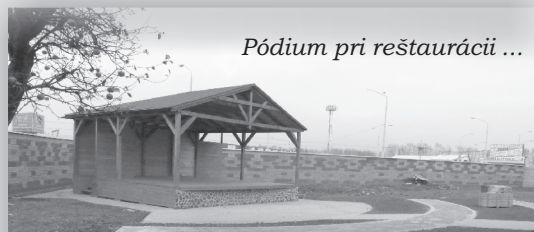
Pódium pri reštaurácii ...

V záhrade pri reštaurácii Obecný dom, kde už je vybudovaná letná terasa a detské ihrisko, sme v uplynulom roku postavili prekryté pódium a vybudovali časť chodníkov. V letnom období pripravujeme organizovať tu rôzne kultúrne podujatia. Aj na túto akciu sme získali dotáciu 10 000 € z ministerstva financií.