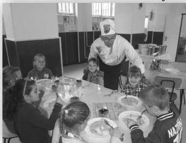
Podľa podkladov vedúcej SJ spracovala Mgr.M.Baňasová.