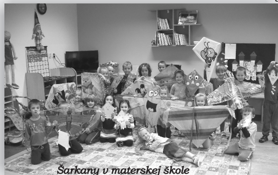
Šarkany v materskej škole