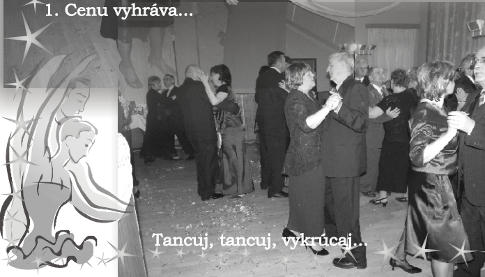
Tancuj, tancuj, vykrúcaj...