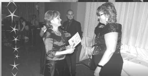
1. Cenu vyhráva...