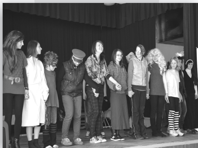
Vedúce Divadelného krúžku a Hudobného krúžku pri ZŠ Ľubotice