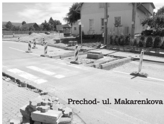
Prechod- ul. Makarenkova