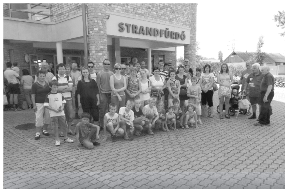
A takto sme si užívali letnú pohodu v Tiszujvárosi 12.7. 2011.