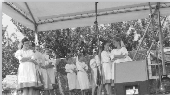
Hudobná skupina Heľenine oči