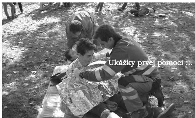
Ukážky prvej pomoci ...