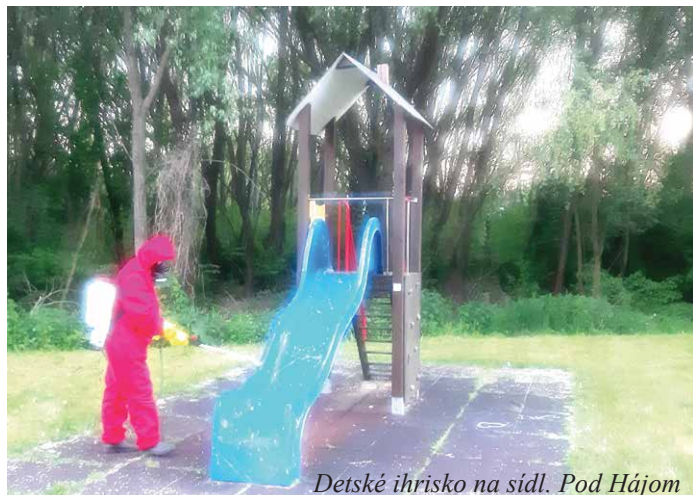
Detské ihrisko na sídl. Pod Hájom