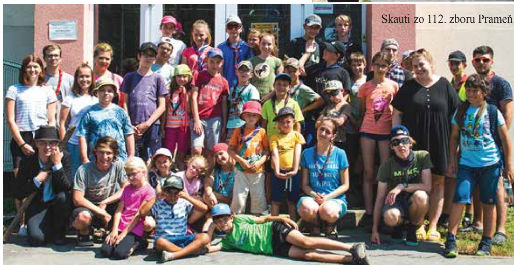
Skauti zo 112. zboru Prameň