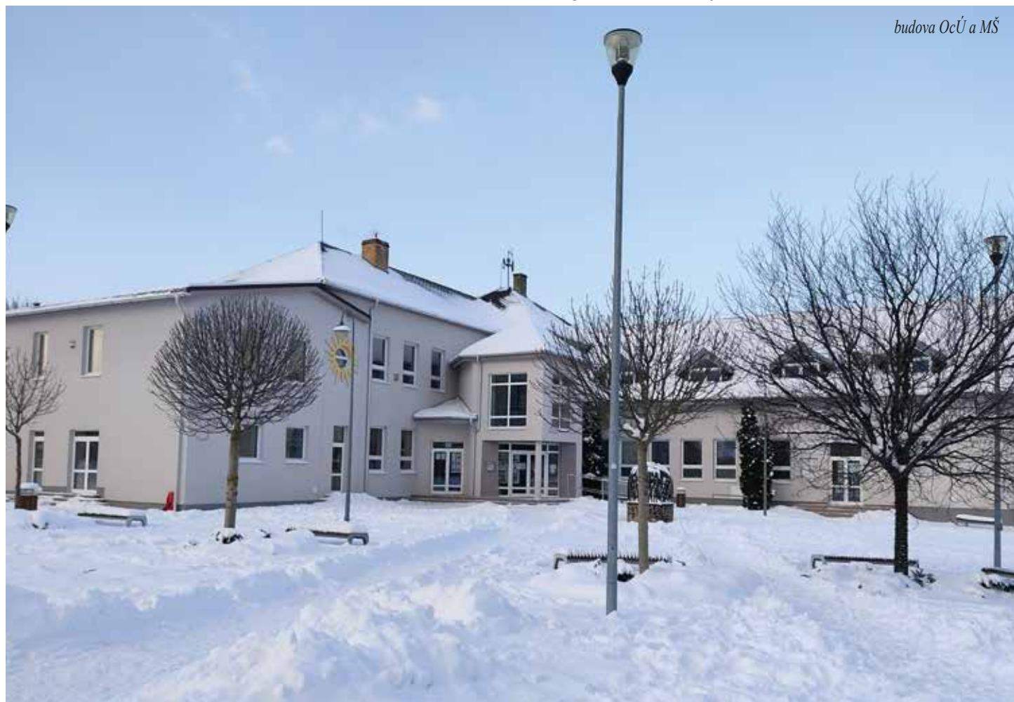
budova OcÚ a MŠ

Tieto práce sa vykonávali v súlade so schválením nenávratného finančného príspevku v rámci projektu „Zníženie energetickej náročnosti budovy Obecného úradu a materskej školy Ľubotice“. Projekt bol spolufinancovaný z fondov Európskej únie so spoluúčasťou obce ako prijímateľa nenávratného finančného príspevku. Cieľom tohto projektu bolo znížiť spotrebu energií pri prevádzke verejnej budovy.